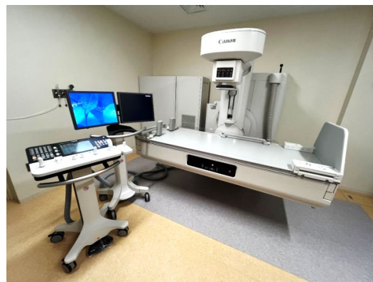
『Astorex i9 キヤノン社製』